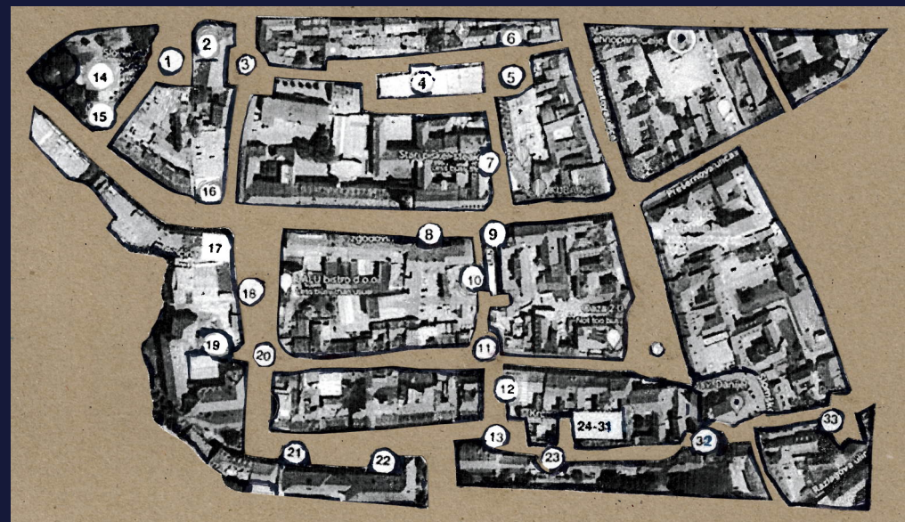
Potovanje po Troji