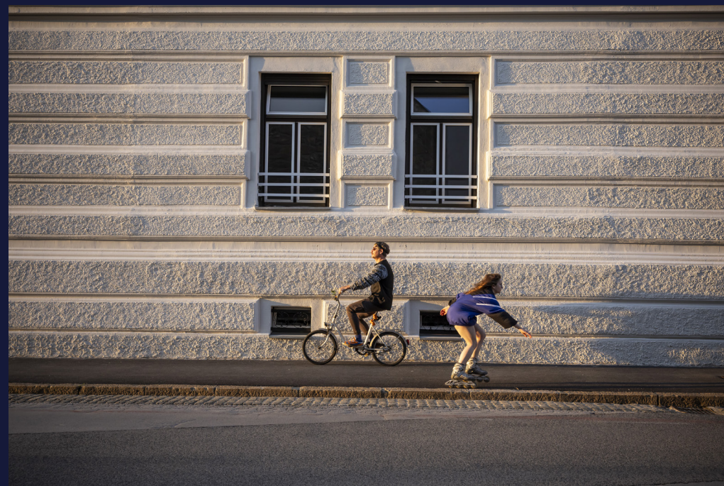
Anže Zevnik, Eva Stražar

4 Zaradi nasprotovanja lokalnih in državnih oblasti se festival ne vrši v notranjosti gradu, kljub podpori lokalnih prebivalcev.