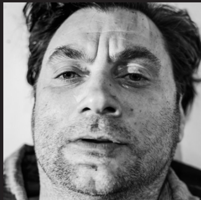
Branko Jordan k. g. (fotografije z vaje)